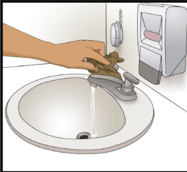
Turn off water with paper towel Cierre la llave del agua usando una toalla de papel