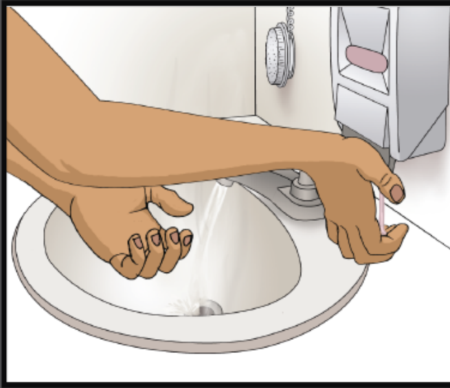
Use soap Use jabón