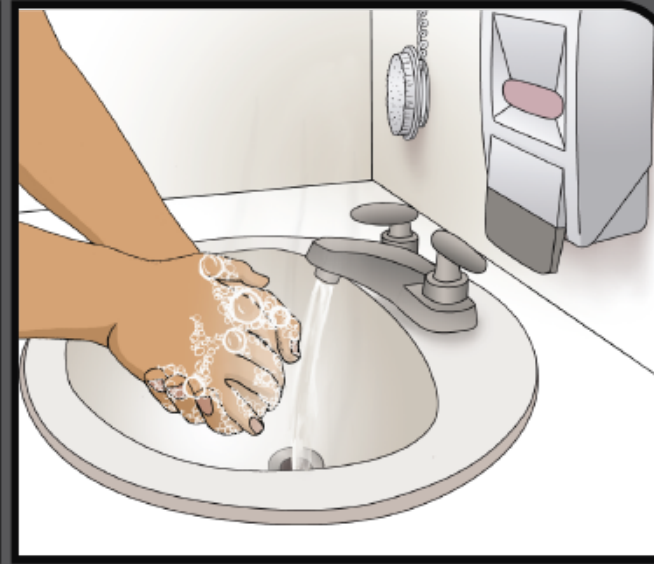
Wash and scrub for 20 seconds Frote sus manos por 20 segundos